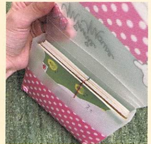
ハガキを収めるプラスチックケースは、100円ショップなどで購入可能です！